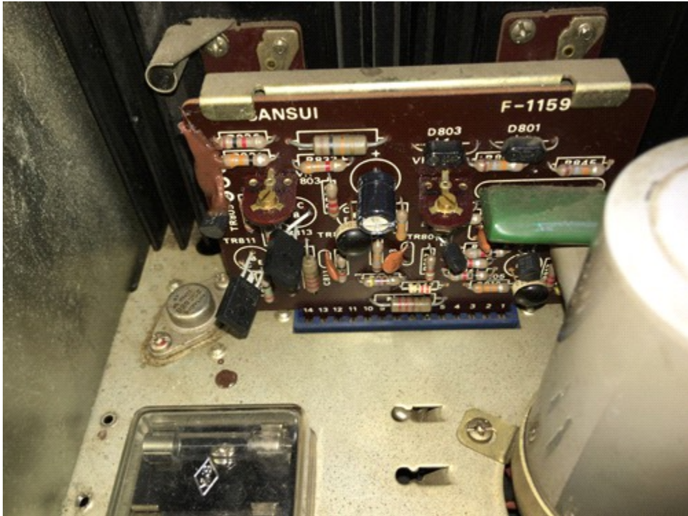
パネルの洗浄など